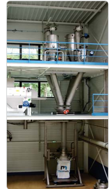
➤ Transfert avec une élévation de 12 mètres