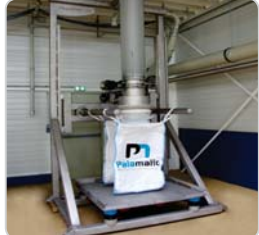
➤ Remplissage big bag : table vibrante et pesée