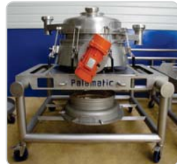
➤ Tamis vibrant