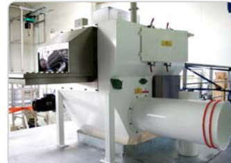
➤ La MINISLIT® : ouverture automatique des sacs