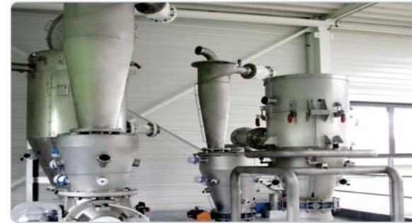
➤ Équipements de transport pneumatique en poussé, aspiré, dilué phase dense