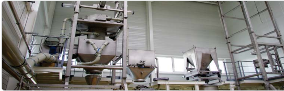
➤ Solution de déconditionnement : big bag, sac, conteneur (semi-automatique, confinement, ergonomie, dépoussiérage ATEX, dépesée des stations, massage big bag)