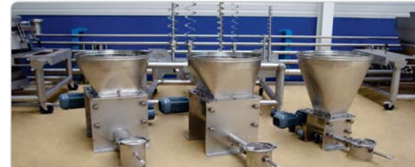
➤ Doseurs à vis : 3 modèles (D11, D12, D13) de 5 à 3 500 litres avec un fonctionnement volumétrique et pondéral