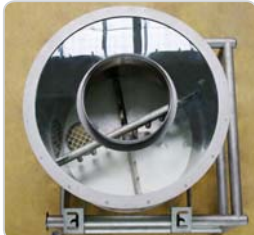
➤ Dévouteur : extraction planétaire et fluidisation