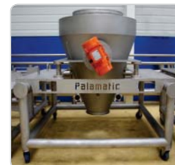
➤ Trémie : vibration et fluidisation