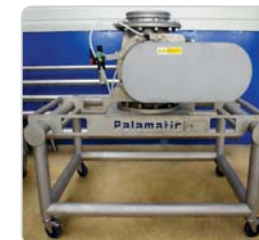
➤ Écluse rotative