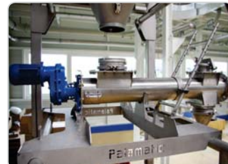
➤ Vis de transfert : easy clean et inclinaison variable